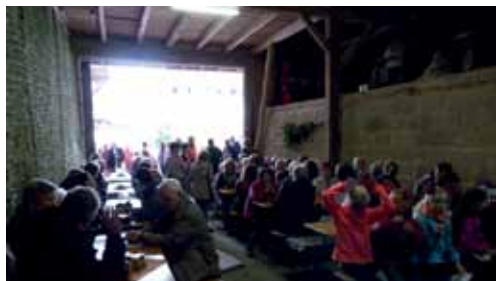
Gut besuchter Gottesdienst

dem Piano begleitet. „Frederick“ hat den „kleinen Mäusen“ und uns gezeigt, dass das Sammeln von Nüssen, Körnern und Stroh nicht ausreicht um durch den langen Winter zu kommen. Wir brauchen auch die Erinnerung an die warmen Sonnenstrahlen und die schönen Farben; und wir brauchen die Wörter, damit wir uns an den langen grauen Wintertagen Geschichten erzählen können.