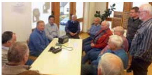
Tastfunk und andere Betriebsarten

Jeden Monat frühstücken sie gemeinsam. In Baunatal gibt es eine muntere Herrenrunde, die sich regelmäßig trifft, frühstückt und sich weiterbildet. Sie hat durch uns vom Amateurfunk erfahren und wollte darüber besser Bescheid wissen. So sind dieses Mal Funkamateure zum „Männerfrühstück“ eingeladen und berichten über ihr interessantes Hobby. Von alter und ganz moderner Funktechnik, von Löschfunkensendern bis HAMNET. Von Telegrafie bis FT8. Von QRP-Spaß bis zu Contest-Schlachten, von SOTA rund um Kassel bis zu weltweiten DXpeditionen. Und alles zum Anfassen und ausprobieren. Und zwischendurch wird auch gefrühstückt.