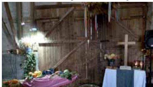
Reichlich gedeckter Altar

Alles in allem war es ein schönes Erntedankfest (... der Regen war doch eigentlich