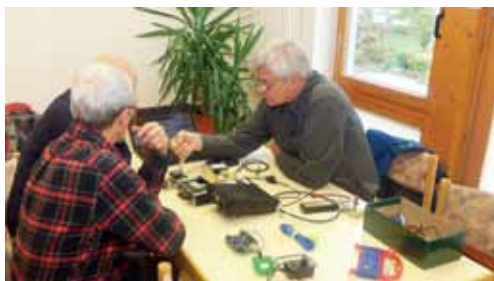
Selbstbauprojekte im Amateurfunk

Noch lange Gespräche. Viele Nachfragen. Die